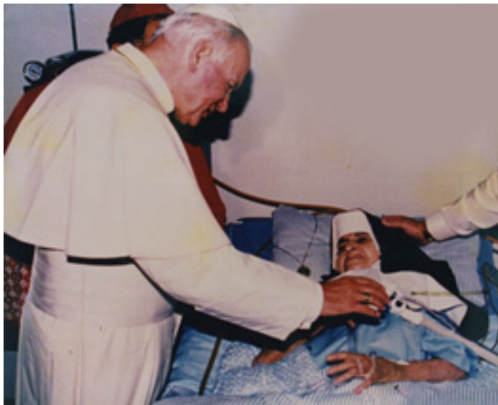
Papa João Paulo II visita Irmã Dulce no leito de morte em 1991

Dois nomes e duas pessoas que nos são muito familiares não só porque nós encontramos frequentemente amigos, conhecidos e desconhecidos que atendem pelo nome de dois apóstolos – João e Paulo, e Dulce pela doçura da freira baiana. Embora famosas, estas duas pessoas nos são tão queridas, porque são gente do nosso tempo que conhecemos de diversas maneiras e circunstâncias. Temos certeza de que viveram em nossa época e conhecemos suas virtudes. Virtudes até comuns para tantas pessoas, mas vividas por elas num grau muito elevado. Reconhecemos isto.