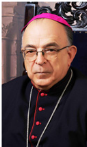
Cardeal Dom Raymundo Damasceno Assis, arcebispo de Aparecida

Mineiro de Capela Nova, Dom Damasceno tem 74 anos e é popular no episcopado por sua capacidade de diálogo e facilidade de acesso ao governo. Foi secretário-geral da CNBB, quando era bispo auxiliar de Brasília; preside o Conselho Episcopal Latino-Americano (Celam).